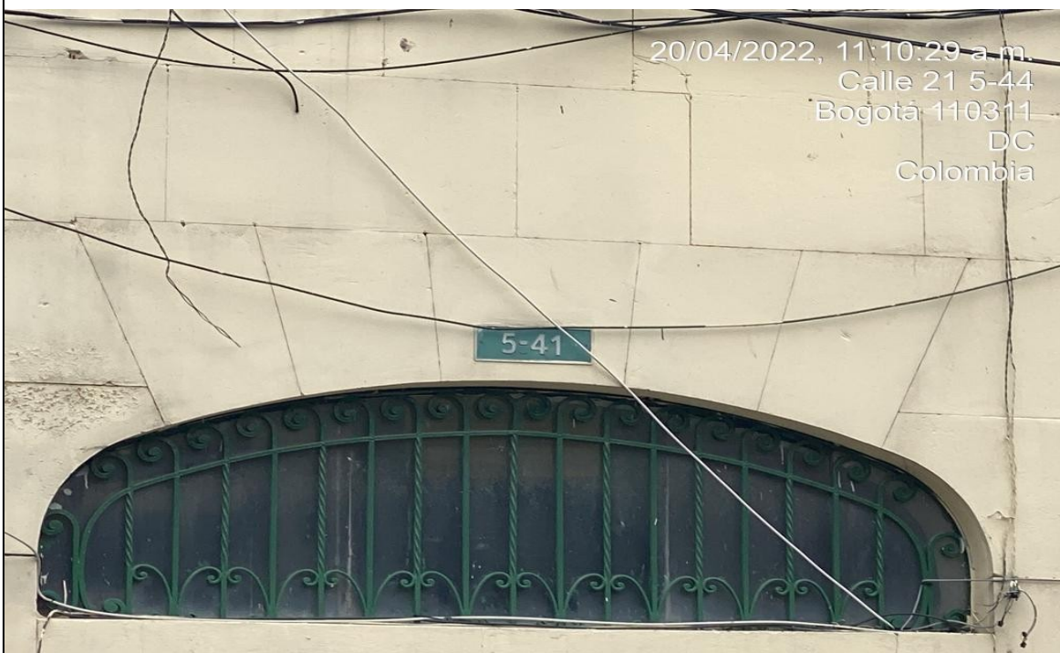
Nomenclatura urbana del predio de referencia