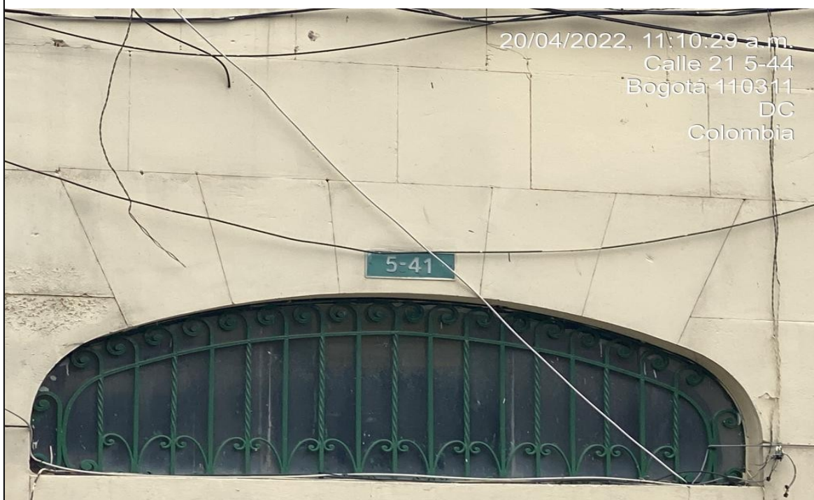
Nomenclatura urbana del predio de referencia